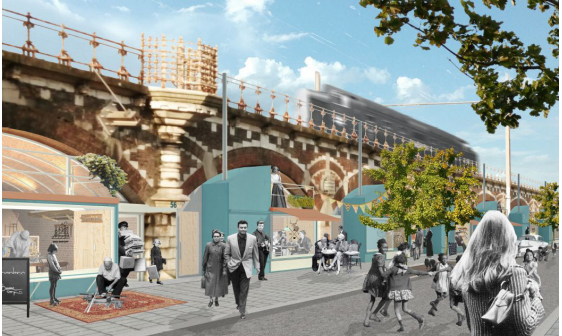
Compagnie O architecten