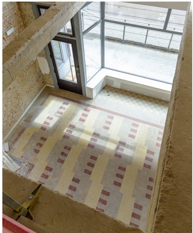
Zicht vanop de mezzanine.

AG Vespa behoudt zich het recht voor om, indien nodig, aanpassingen aan te brengen aan deze bundel en bijhorende documenten. In dat geval zal deze informatie kenbaar gemaakt worden via de website van AG Vespa. Het is dus aangeraden dat kandidaten regelmatig de website van AG Vespa raadplegen.