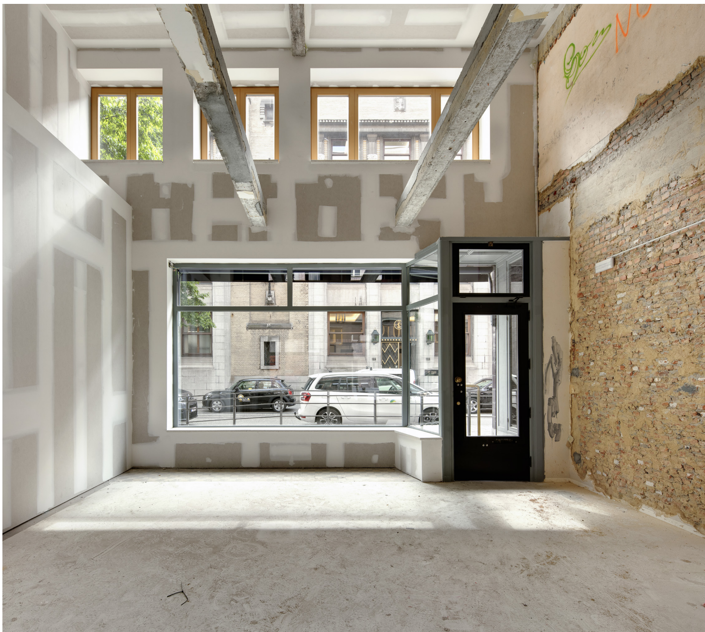
Eén van de twee grote vitrines van dit handelspand in de Nationalestraat.

De huurder staat zelf in voor alle andere (inrichtings)werken die noodzakelijk zijn voor de exploitatie van de handelszaak. Het gaat hier over handelspand B.O.1 gelegen in de Nationalestraat 156, 2000 Antwerpen . Dit pand is momenteel vergund als detailhandel. Het beschikt over een gelijkvloerse verdieping van ca. 107 m 2 met een mezzanine van 62 m 2 en een kelder van ca. 49 m 2 .