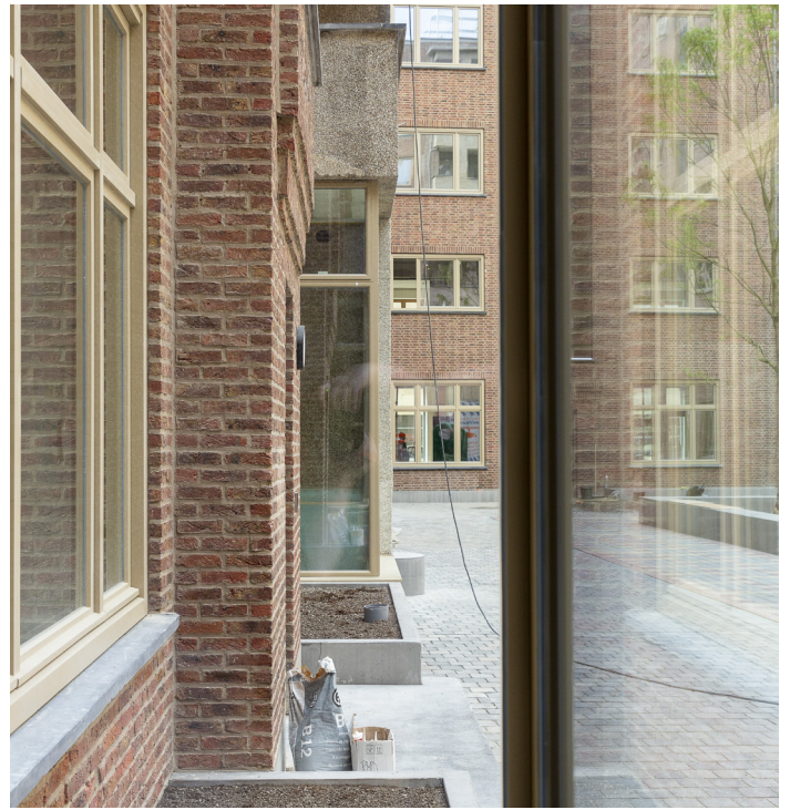
Achteraan zicht op de binnenplaats van de Fierensblokken.