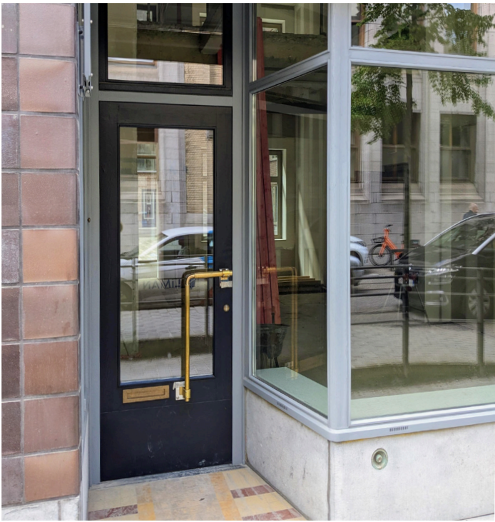
Met authentieke elementen zoals deuren en vloeren.