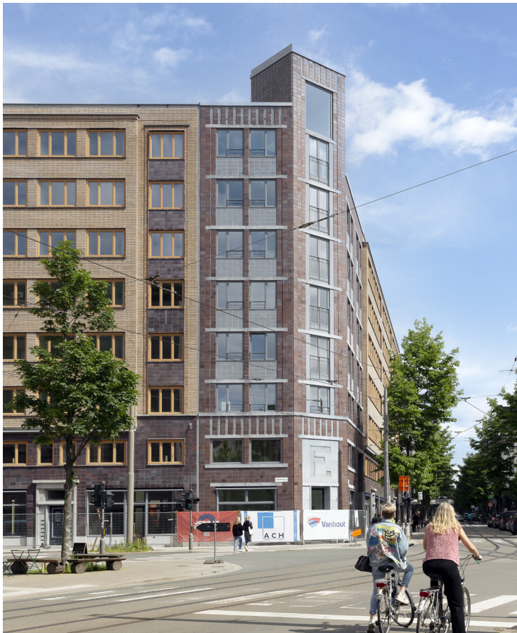
Goed gelegen handelspanden in de gerenoveerde Fierensblokken.

Filip Daenen 0456 21 19 32 filip.daenen@antwerpen.be