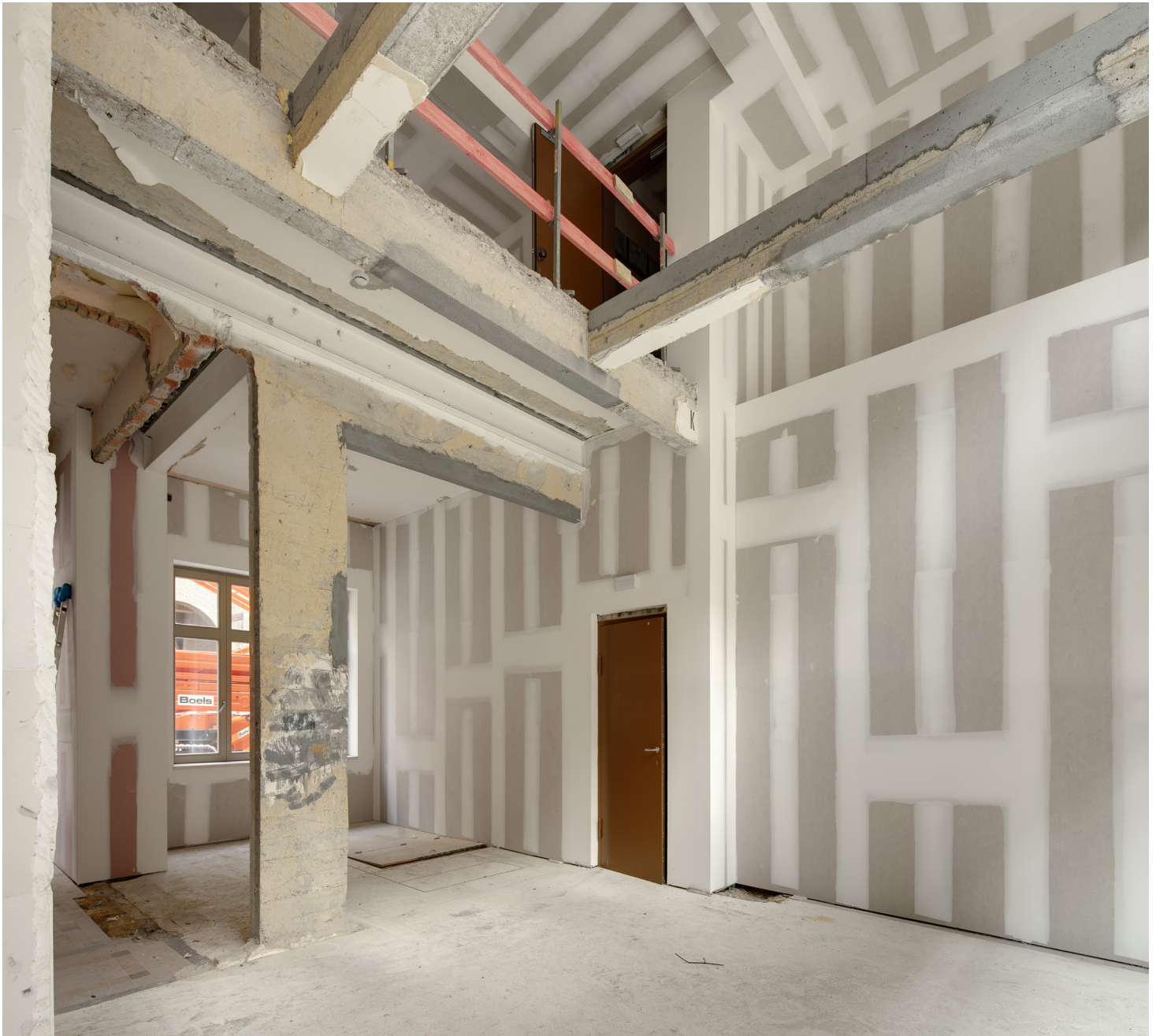
Zicht op de mezzanine en de achterzijde van het pand.