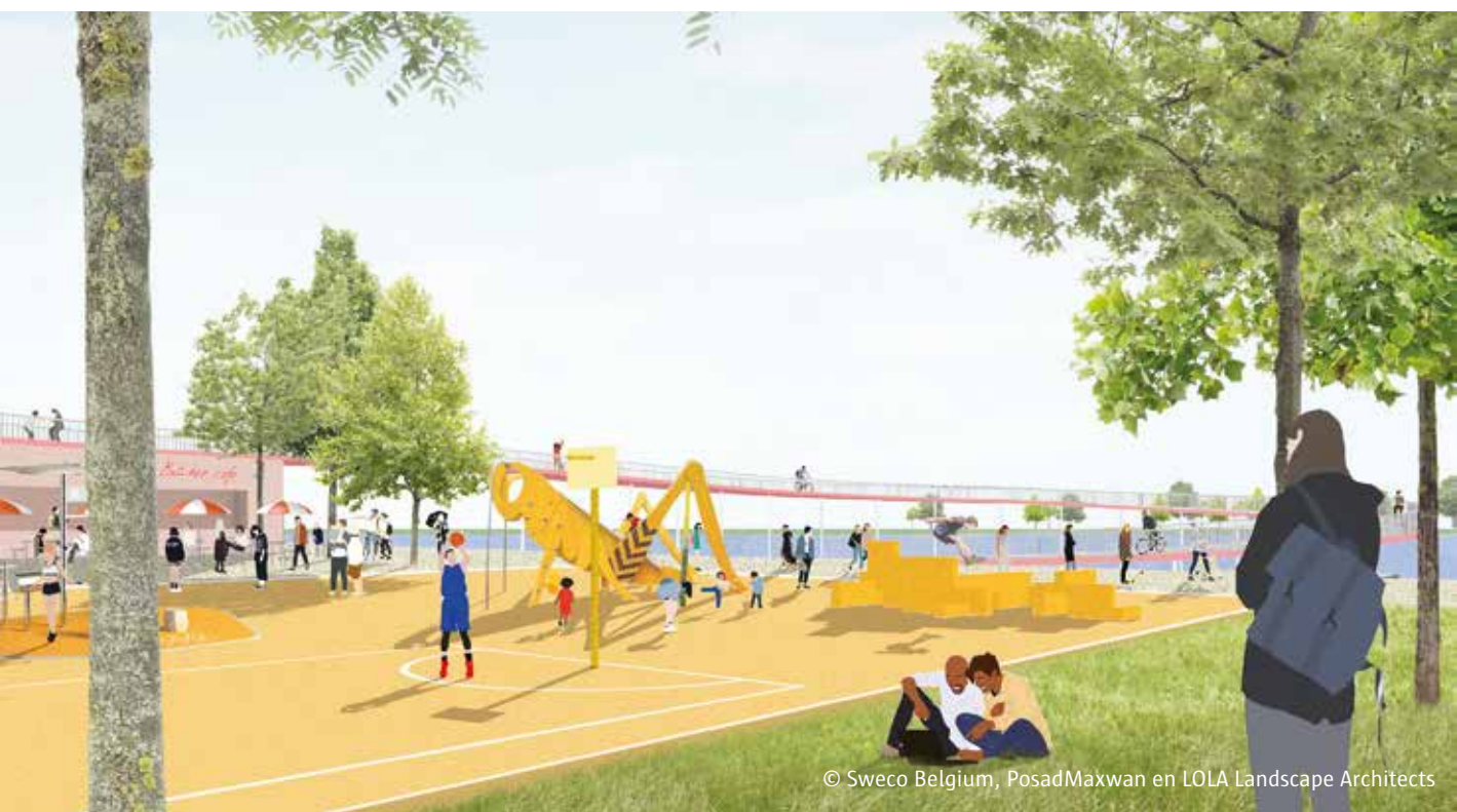
© Sweco Belgium, PosadMaxwan en LOLA Landscape Architects