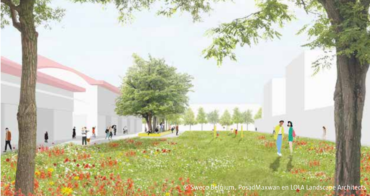
© Sweco Belgium, PosadMaxwan en LOLA Landscape Architects