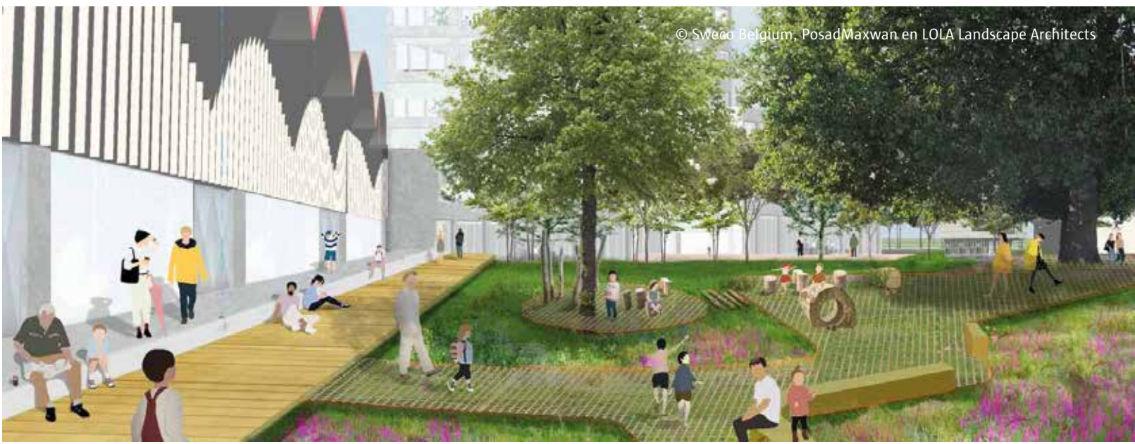
© Sweco Belgium, PosadMaxwan en LOLA Landscape Architects

De woonstraat langs de Hallentuin wordt een autoluw woonerf. Langs het pad komen plantvakken waarin, net als in de tuin, regenwater wordt opgevangen.