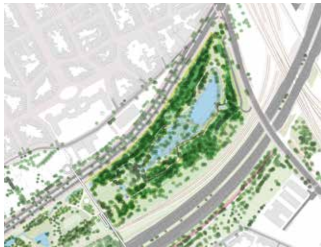
Het ontwerpplan van het voorontwerp van Wolvenberg © CLUSTER landschap & stedenbouw

Het ontwerp voor Wolvenberg is een ruimtelijke doorvertaling van de landschapsvisie in het natuurbeheerplan. Voor Wolvenberg stelt het ontwerp alvast voor om het centrale gedeelte (inclusief de vijver) als halfopen graslanden te ontwikkelen met eromheen halfopen bossen. Een padennetwerk vormt een lus om de vijver en het centraal lager gelegen gedeelte. De paden zoeken zo veel mogelijk de open plekken op en zijn zo ingericht dat ze betreding van het natuurgebied zelf voorkomen. Op drassige tot natte bodems worden vlonders aangelegd. Poelen die onder andere door bladafval te ondiep zijn geworden en dus te snel droog vallen, worden opnieuw verdiept zodat amfibieën de tijd krijgen om zich te ontwikkelen. In droge delen van het natuurgebied wordt het pad afgebakend door houten palen met touw. Langs de paden komen voldoende rustplekken.