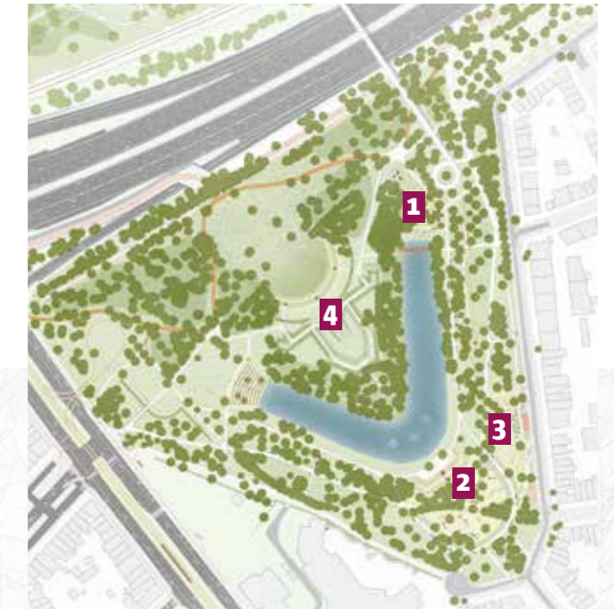
Het ontwerpplan van het voorontwerp van het Brilschanspark © CLUSTER landschap & stedenbouw

Langs de paden en aan verblijfsplekken komen zitbanken, picknickbanken en ligbanken. Gemetste muurtjes vormen ook zitelementen verspreid over het park. Langs de belangrijkste parkpaden komt verlichting.