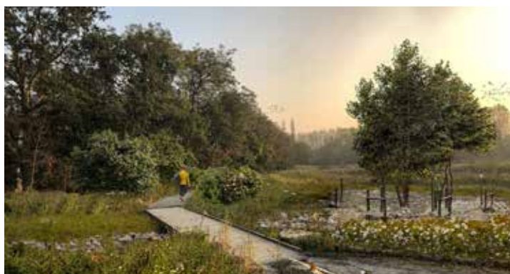
Een toekomstbeeld van het waterzuiveringssysteem in natuurpark Wolvenberg © CLUSTER landschap & stedenbouw – Sweco

In het ontwerp voor Wolvenberg is ook een zone aangeduid voor het Natuurhuis Brialmont. Stad Antwerpen, Agentschap voor Natuur en Bos, departement Omgeving van de Vlaamse overheid en Natuurpunt slaan daarvoor de handen in mekaar. Het Natuurhuis zal dé plek worden voor steden, gemeenten, scholen, bedrijven, verenigingen en iedereen met interesse in stedelijke natuur en in de manier waarop die bijdraagt aan de leefbaarheid, aantrekkelijkheid en weerbaarheid tegen de gevolgen van de klimaatopwarming. Het Natuurhuis wordt een ontmoetingsplek, er komen tentoonstellingen over stadsnatuur en het is de startplek voor begeleide wandelingen en excursies rond natuur en erfgoed.