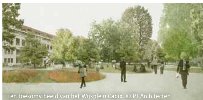
Een toekomstbeeld van het Wijkplein Cadix. © PT Architecten

AG VESPA is volop bezig met de aanleg van het nieuwe Wijkplein Cadix. De grote bomen die tijdelijk aan de Mexicobruggen stonden, hebben er al hun definitieve plaats gekregen. De opening van het plein is voorzien op zaterdag 10 juni. Vanaf dan kunnen uw (klein)kinderen genieten van de nieuwe speeltuin. Tegen de zomer wordt er gestart met de heraanleg van de Napelsstraat van Indiëstraat tot August Michielsstraat. Tegen dan zal ook het nummerplaatherkenningssysteem (ANPR) operationeel zijn, zodat u autovrij kan genieten van het nieuwe Wijkplein Cadix.