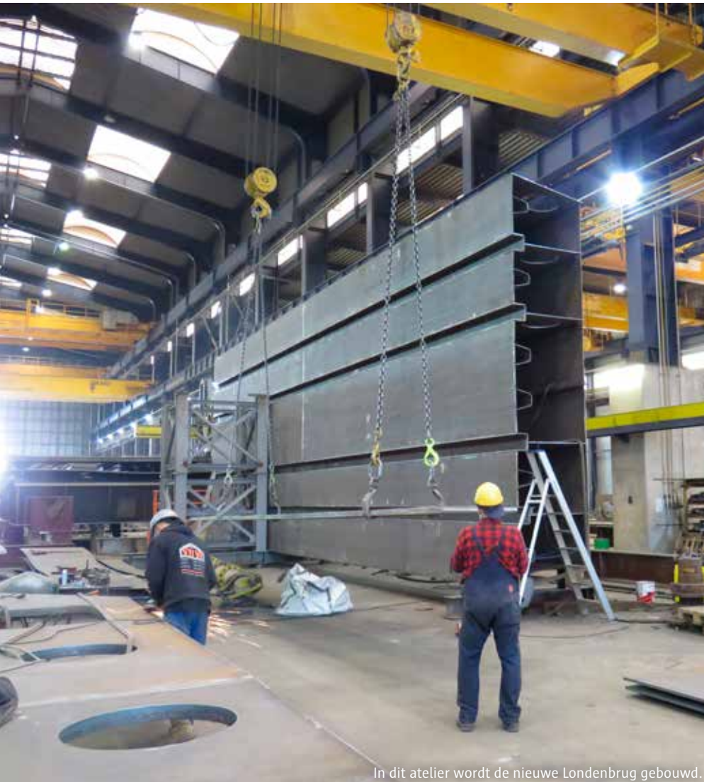
In dit atelier wordt de nieuwe Londenbrug gebouwd.

Bijna een jaar geleden ging op het Eilandje de eerste schop in de grond voor de werken aan de Noorderlijn. Nu, een jaar later, is het eerste deel van de werken bijna klaar. De Lijn moet de nieuwe spoorinfrastructuur nog testen. Zo kunnen we de nieuwe sporen in gebruik nemen voor we in juni met de werken aan het nieuwe Operaplein starten.