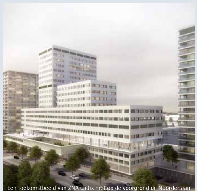
Een toekomstbeeld van ZNA Cadix met op de voorgrond de Noorderlaan.

Met de bouw van ZNA Cadix wordt ook het openbaar domein heraangelegd, van de voorgevel van het ziekenhuis tot aan de dokrand. Momenteel wordt er gewerkt aan een voorontwerp. Dat ontwerp zal nog voor de zomer worden voorgesteld aan de buurt.