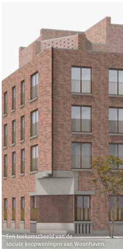
Een toekomstbeeld van de sociale koopwoningen van Woonhaven.