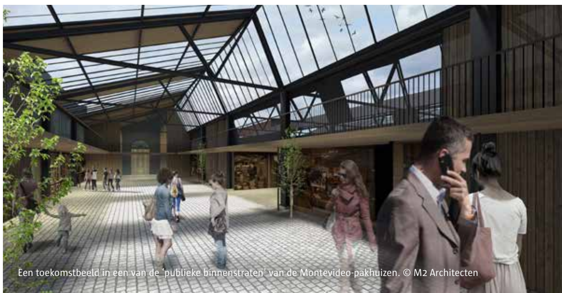
Een toekomstbeeld in een van de 'publieke binnenstraten' van de Montevideo-pakhuizen. © M2 Architecten