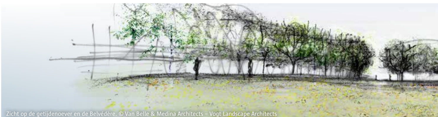
Zicht op de getijdenoever en de Belvédère. © Van Belle & Medina Architects – Vogt Landscape Architects

Het Droogdokkeneiland is 24 hectare groot en ligt in de Scheldebocht in het noorden van het Eilandje. De heraanleg ervan verloopt in fases. Eind april start de aanleg van De Belvédère (een architecturaal uitkijkpunt) en de parking. Later volgt de nieuwe Sigmadijk, de natuurlijke oever en de rest van het park.