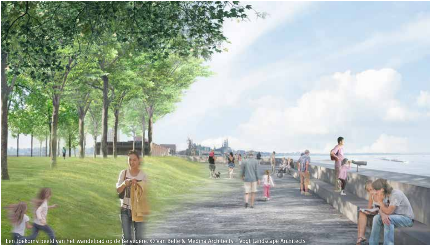
Een toekomstbeeld van het wandelpad op de Belvédère. © Van Belle & Medina Architects – Vogt Landscape Architects