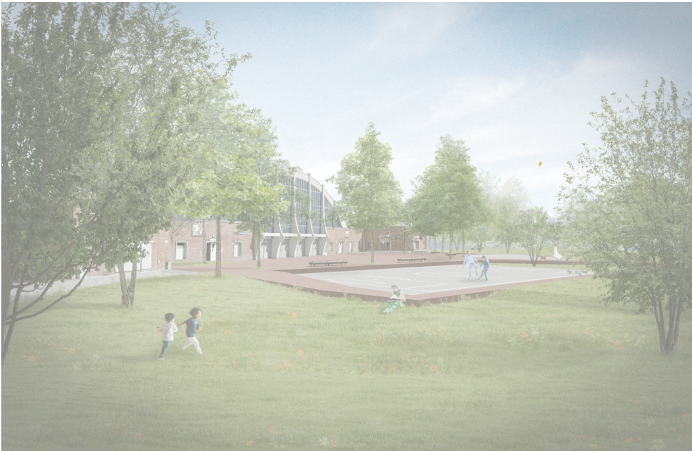
Een toekomstbeeld van het definitieve ontwerp van het Arenaplein © CLUSTER landschap & stedenbouw

De resultaten van de inspraak over de publieke ruimte vind je op deze pagina onder 'Downloads'.