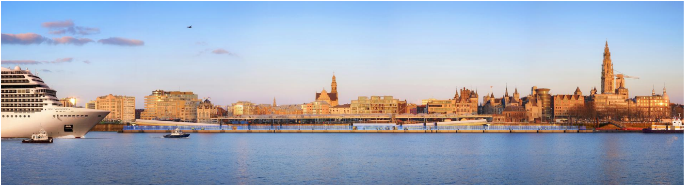
Toekomstbeeld ponton van op Linkeroever © Ney & Partners (ontwerp) - bmd3d (visualisatie)

Passagiers zullen onthaald worden in Het Steen, dat volledig gerestaureerd en uitgebreid wordt. De werken aan het ponton zijn in november 2018 gestart en worden in het najaar van 2020 afgerond.