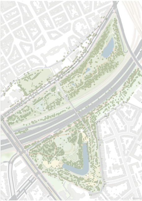
Definitief ontwerp van fase 2 van Park Brialmont © CLUSTER landschap & stedenbouw