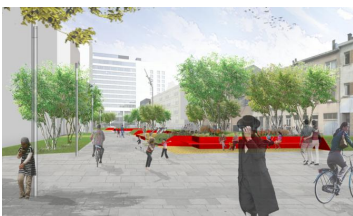
Toekomstbeeld van het noordelijke deel van het openbaar domein Kievit II © BUUR - HOSPER

In september 2015 is de aanleg van het zuidelijke deel van het nieuw openbaar domein gestart. Dat is vanaf de Somersstraat, over de Plantin en Moretusbrug, tot aan de Baron Joostensstraat. Het openbaar domein bestaat onder andere uit verhoogde groenkussens met nieuwe bomen en bloemen en rode zitbanken waarin spelborden zijn verwerkt. Er is een 'multicourt', een sportkooi voor voetbal en basketbal, en een verticale speelwand om op te klimmen en te spelen op de spoorwegbrug over de Plantin en Moretuslei, tussen de Van Immerseelstraat en de Baron Joostensstraat. In juni 2017 was er een feestelijke opening.