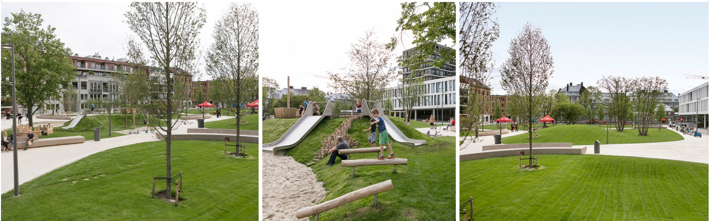
Opening oostelijk deel Schengenplein op 10 juni 2017

In 2017 opende het eerste deel van een volledig nieuw groen wijkplein: het Schengenplein. Het groene plein, ontworpen door PTArchitecten, ligt op de voormalige parking van het oude douanegebouw en is autovrij. Het ligt langs weerszijden van de Kattendijkdok-Oostkaai waar ook een tram rijdt. In 2023 opende ook het tweede deel van het plein met een houten ponton in het Kattendijkdok.