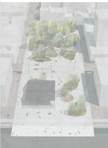
Toekomstbeeld volledig aangelegd Schengenplein © PT Architecten