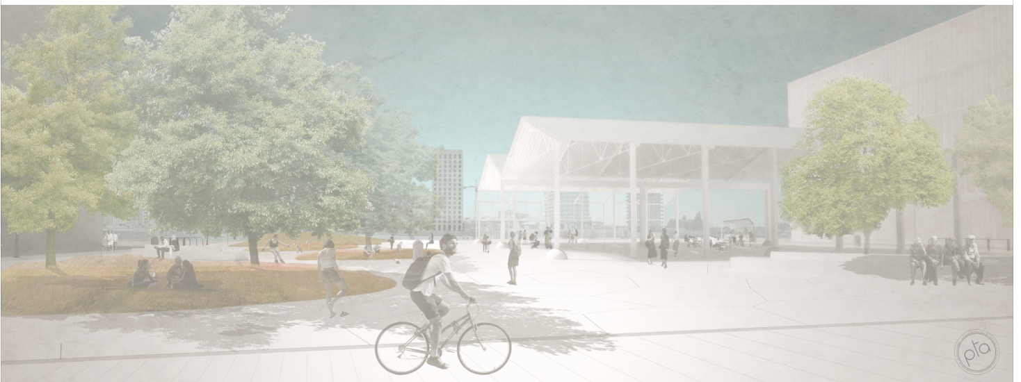
Toekomstbeeld westelijk deel Schengenplein aan het water © PT Architecten