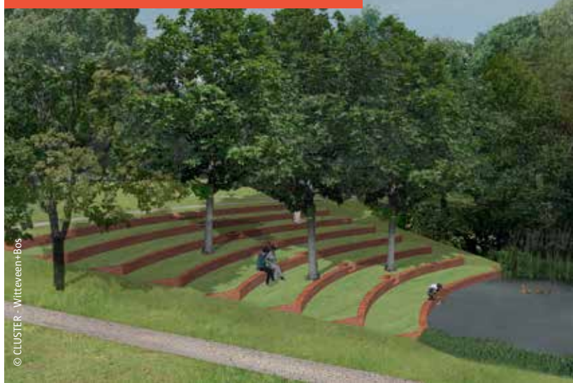
entree Grotesteenweg - terrassenstructuur aan vijver

In de buurt van deze entree komt ook een ligweide die in verbinding staat met de Brilschansvijver door een langgerekte terrassenstructuur (zie afbeelding hierboven).